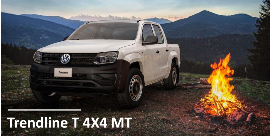
Trendline T 4X4 MT