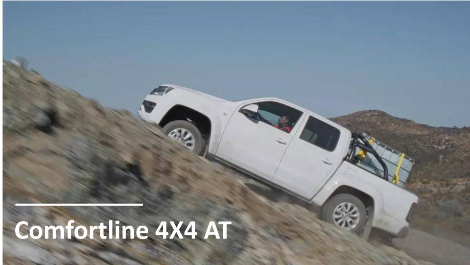
Comfortline 4X4 AT