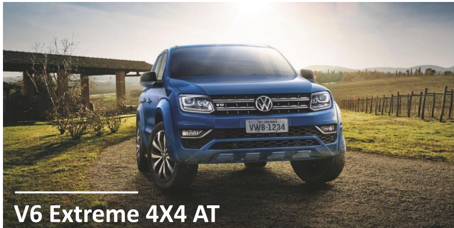
V6 Extreme 4X4 AT