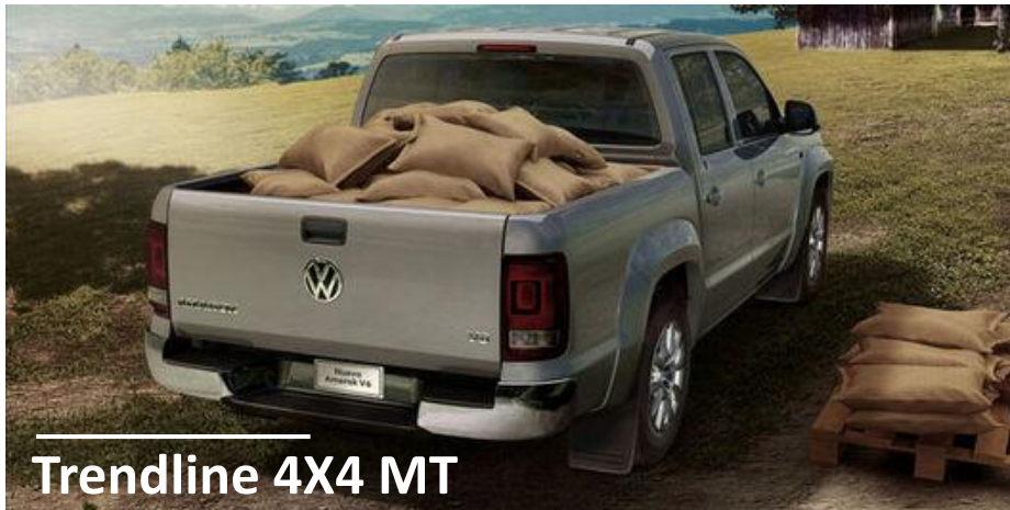
Trendline 4X4 MT